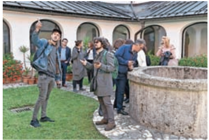
Digitalizirano Romualdovo (pasijonsko) pot je mogoče spoznavati s pametnim telefonom ali tablico v roki.

bno škofjeloško naložbo. Navzoči so bili tudi predstavniki pobratenega Freisinga, ki so spomladi prav tako prejeli cepič najstarejše trte na svetu.