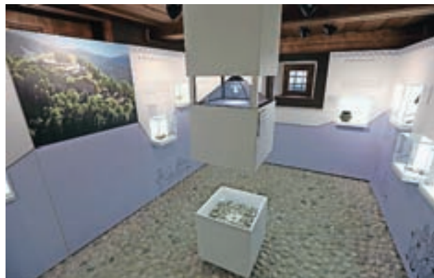
Spominska soba Ajdna