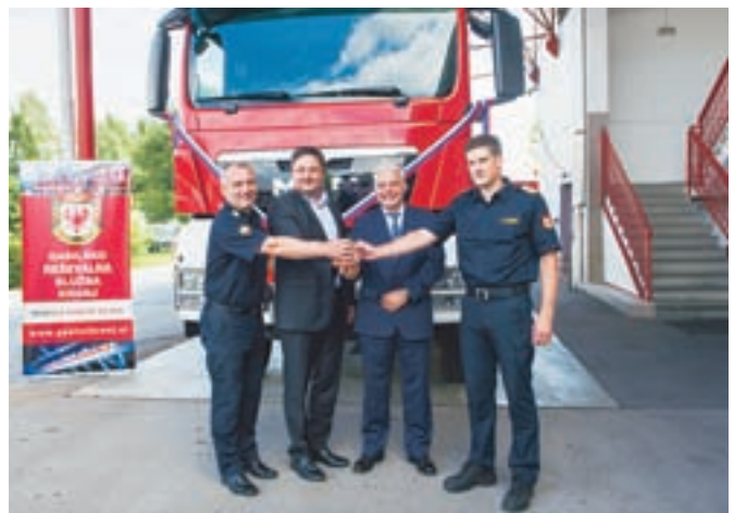
Gasilsko reševalna služba Kranj ima novo gasilsko vozilo.