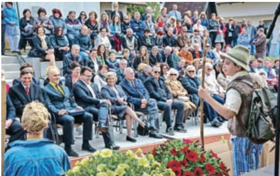
Na praznovanju smedniškega zavoda so zaigrali tudi Butalce, ki jih je napisal Fran Milčinski, rojen pred 150 leti.