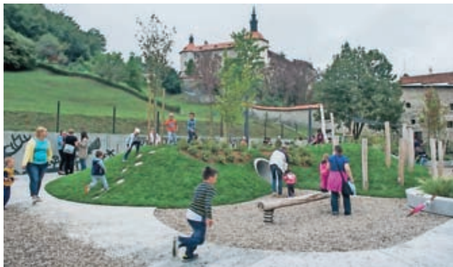
Jeseni so odprli nov Trg pod gradom in otroško igrišče Zamorc.

Septembra so Trg pod gradom slovesno odprli, dogodek je obogatilo tradicionalno mednarodno srečanje pihalnih orkestrov Loka jo piha. Odprli so tudi tematsko otroško igrišče Zamorc, ki je dobilo ime po znani legendi o črnem možu z loškega grba. Igrišče je tudi sicer zasnovano v slogu škofjeloških legend, ki jih otroci spoznavajo ob igri. Novembra, teden dni pred martinovim, pa so ob grajsko obzidje zasadili trto z Lenta in z veliko prireditvijo zakročili to pomem-