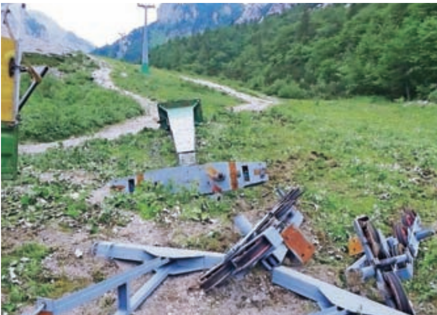
Po 47 letih obratovanja so podrli stebre legendarne žičnice na Zelenico.

dva milijona evrov vredno v Begunjah izdelano jahto. Občini Medvode in Vodice sta bili vključeni v doslej največji okoljski projekt v Sloveniji za odvajanje in čiščenje odpadnih voda. Projekt zadeva nad 250 tisoč ljudi. V lipniški tovarni iskra Mehanizmi so zaposlili blizu dvesto novih delavcev. Tovarna obratuje že šestdeset let in ima obrat tudi v Kamniku. Podjetje Mebor iz Železnikov je v Sibiriji zgradilo v Sibiriji novo linijo za razrez lesa. Vlada je odločila, da bo do leta 2021, ko bo za pol leta predsedovala Evropski uniji, obnovila двореc in hotel na Brdu. Na Visokem v Poljanski