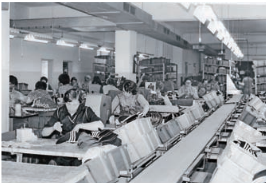
Šivalnica gornjih delov obutve, obrat (TOZD) kranjske Planike na Breznici, 24. 6. 1980