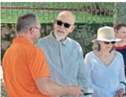
Obisk velikega ameriškega igralca Johna Malkovicha na Bledu

Dobro obiskane so bile tudi številne druge znamenitosti na Bledu in v okolici, še posebno športno-turistični objekti, v katere občina prav tako veliko vlaga. Potrditev svoje strategije in zavezanosti športu je Bled dobil z razglasitvijo za najbolj športno turističen kraj na svetu