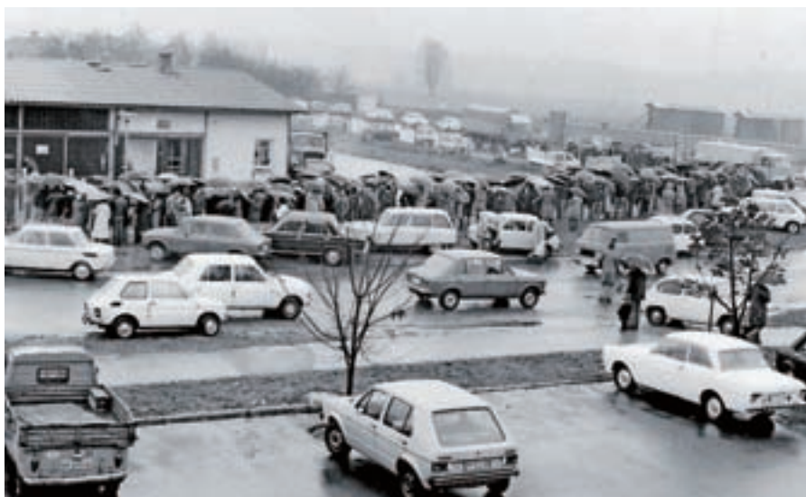
Čakalna vrsta za plin v Plinarni Kranj na Primskovem, 12. 11. 1982