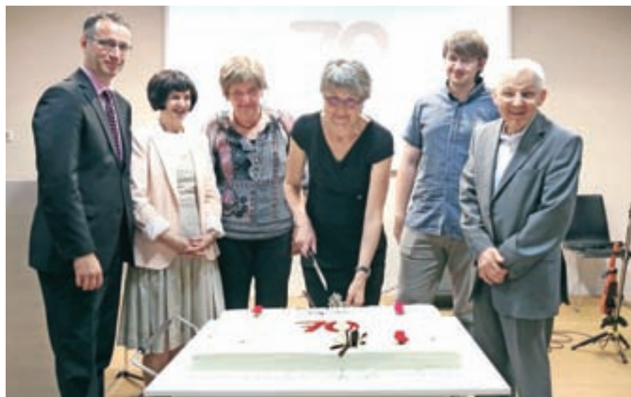
Sodelavci kranjske knjižnice in minister za kulturo Tone Peršak ob jubilejni torti.