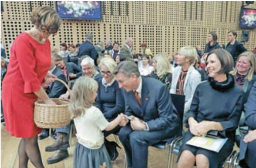
Na dobrodelni prireditvi za pomoč Centru Korak sta bila tudi predsednik republike Borut Pahor in ministrica Andreja Kopač Mrak.

evrov. V Gorenji vasi so obnovili zadrugi dom in trgovino v njem. V Radovljici so predstavili načrt za parkirno hišo z okrog tristo parkirnimi mesti, ki bi jo postavili ob avtocestnem odcepu za Lesce in Bled in tako zmanjšali prometno gnečo v turističnih krajih zgornjega dela Gorenjske ter pospeševali uporabo električnih avtomobilov in koles.