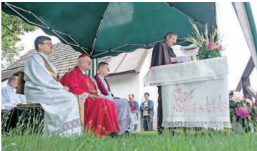
Pred občinskim praznikom so na Sv. Jakobu pripravili slovesnost ob prevzemu planinske koče in mašo, kjer je somaševal kardinal Franc Rode.

Letos začenjajo gradnjo vodovoda Bašelj-Mače, prva faza bo potekala v Bašlju.