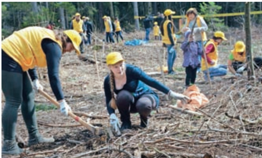
V Zbiljskem gaju so posadili 1001 sadiko gozdnega drevoja.