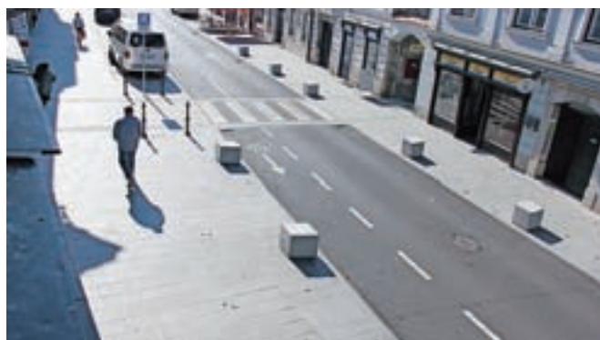
... in po njej