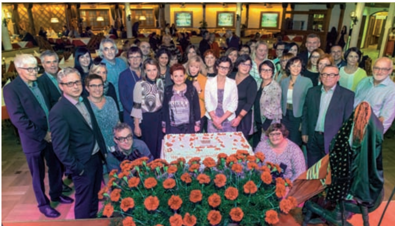
Rojstnodnevna torta za novinarje, dopisnike, fotografe, lektorje, oblikovalce, komercialiste in druge zaposlene, zaradi katerih je Gorenjski glas vedno svež, aktualen in berljiv.