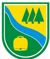
Občina Gorje Zgornje Gorje 6b Zgornje Gorje