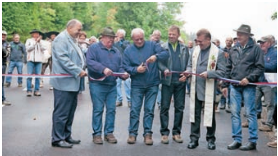
Uradno odprtje ceste na Ambrožu