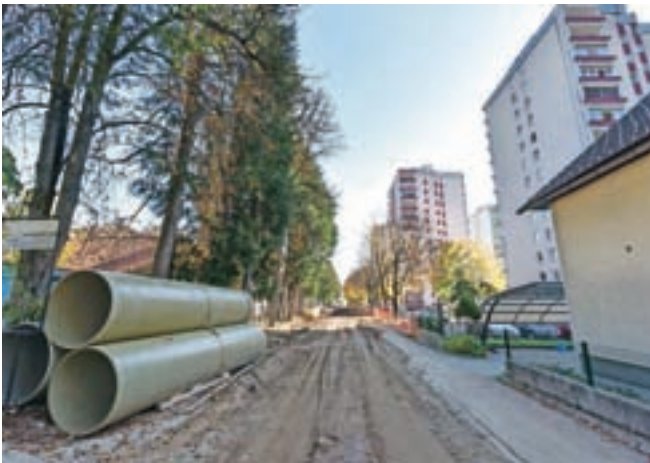
Gradijo komunalno infrastrukturo do zemljišča, kjer bo stal novi vrtec Kamnitnik.