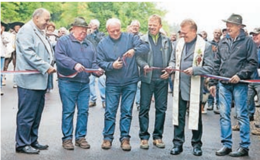
Odprte obnovljene ceste na Ambrožu pod Krvavcem. Z njo so ti kraji bližje dolini.

evropskega denarja urejajo kanalizacijo. V Škofji Loki so odprli nov Trg pod gradom, kjer je bilo prej parkirišče. V Kamni Gorici so obnovili Langusovo kapelico. Na Ambrožu pod Krvavcem so preplastili cesto. Občina Cerklje je v zadnjih letih na območju Krvavca preplastila osem kilometrov cest. Občine Kamnik, Domžale, Mengeš in Moravče so končale 11 milijonov vreden projekt oskrbe s pitno vodo. Projekt je vodila Občina Kamnik. Na Studencu pri Domžalah so zgradili nov dom krajanov in društev, v Ihanu pa šolo, v kateri je tudi knjižnica. Občina Kranjska Gora in Agrarna skupnost Podkoren sta se dogovorili glede uporabe parkirišča pri Zelencih. V Komendi so zgradili novo šolo, vredno 725 tisoč evrov, v Domu Petra Uzarja v Bistrici pri Trziču pa so končali obsežno obnovo, vredno več kot pol milijona evrov.