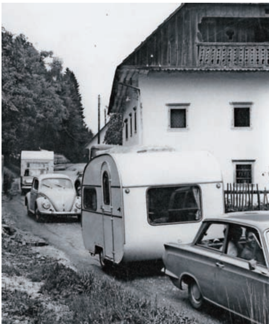
Gost promet v turistični sezoni po stari gorenjski cesti – skozi vas Podbrezje, julija 1966

škrate in delil darove. Dedek Mraz je delil darove vsem enako, dočim je škrate delil tistim, ki so mu razvozlati razne postavljene uganke. Najboljši pionirji pa so razen tega dobili kot nagrado še vsak po eno lepo knjigo. V Trziču so tovarne stopile v medsebojni stik ter porazdelile stvari tako, da so otroci po vseh tovarnah dobili enaka darila. Razen vseh otrok so bili povabljeni tudi starši in so malčke razen daril še pogostili. Tako so mladi kot stari občutili, da je to res nov otroški praznik. V Škofji Loki je prireditev Novoletne jelke prav tako dobro uspela. Partizani so pripovedovali razne zgodbe in doživetja iz partizanskih let. Dedek Mraz je v spremstvu palčkov obšel 700 otrok in jih vse obdaroval. V Kranju je bila ta otročja prireditev organizirana na več mestih, ali nikjer ne tako, kot bi bilo potrebno. Če je bila v kakšni tovarni obdaritev večja, so bili obdarjeni samo otroci, katerih starši delajo v tisti tovarni. Centralna obdaritev pa je bila več ali manj borna, ker so otroke samo pogostili. V nedeljski prireditvi je ta stvar le bolj uspela. Napake, ki so se zgodile v Kranju, pa bodo za bodoče v svarilo vsem organizacijam, kako se k takšnim prireditvam ne pristopa.«