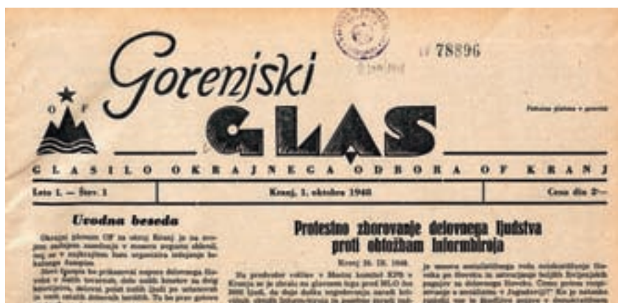
Naslovnica oziroma glava prve redne številke Gorenjskega glasa, ki je izšla 1. oktobra 1948.