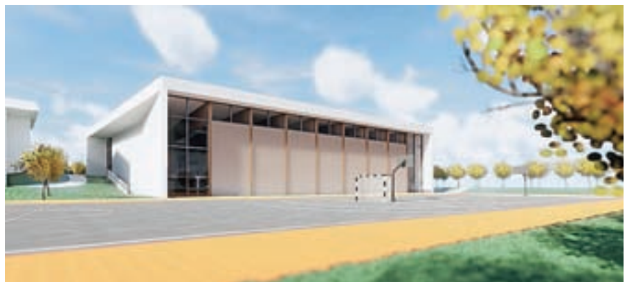
Drugo leto bodo v Mengšu začeli graditi težko pričakovano športno dvorano.