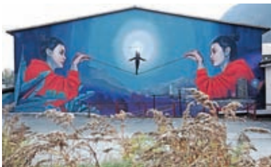
Urbana stenska poslikava mural