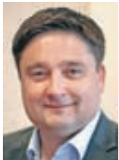
Župan Boštjan Trilar