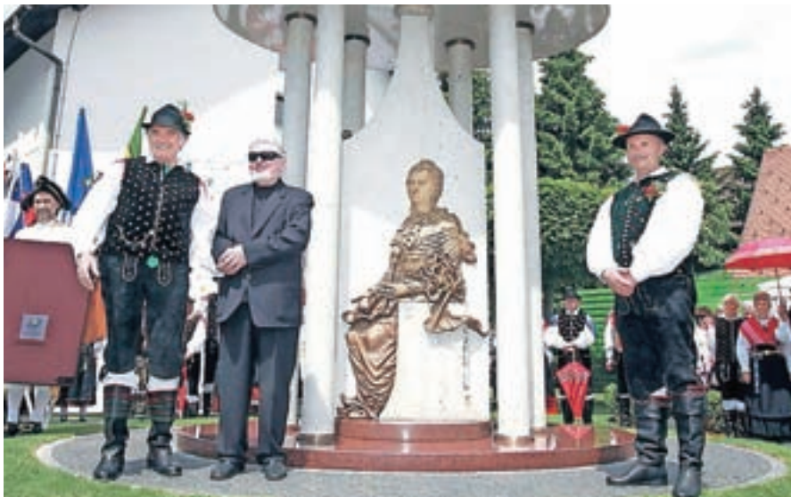
Marija Terezija je našim prednikom ukazala saditi krompir. Na to spominja spomenik sredi Šenčurja, ki so ga odkrili leta 2008.

podložnikov. Pred 250 leti je na Kranjskem ukazala saditi krompir, da ljudje ne bi bili lačni. Vladarica ima veliko spomenikov. Eden od njih, ki slavi tudi uvedbo sajenja krompirja, je tudi v Šenčurju. Upravna enota Radovljica je ljubljanski nadškofiji vrnila še dobrih osemsto hektarov gozda na Pokljuki, ki ima tako v lasti večino poključskih gozdov. V postopku je bilo še nekaj gozdov na območju Mrzlega studenca. Občina Preddvor je dobila v last planinsko kočjo na Jakobu nad Preddvorom. Upravljalo jo bo Planinsko društvo Preddvor. V Mengšu so praznovali občinski praznik.