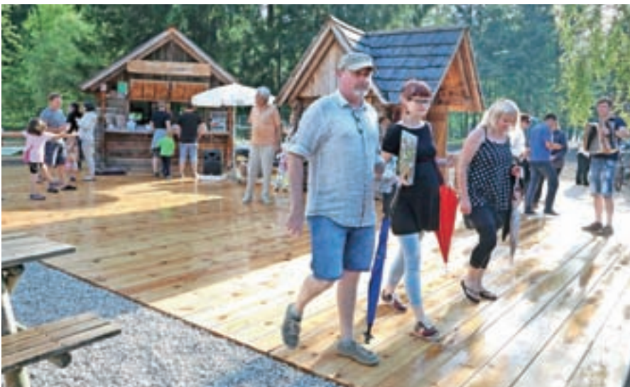
Nova informacijska točka ob Savi pred Mojstrano