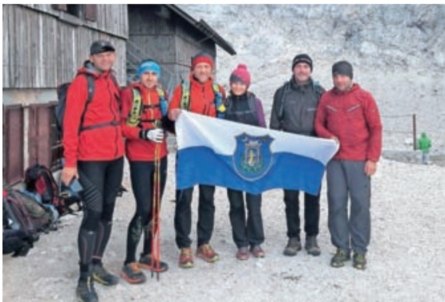
Ekipa planincev, ki je v pičlih 24 urah prehodila pot od Kamniške Bistrice do Triglava.