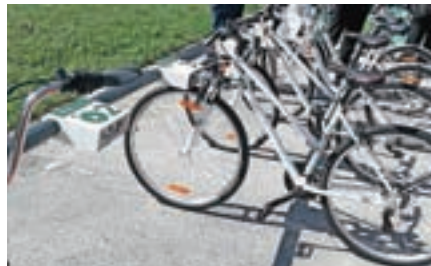
Avtomatski sistem izposoje koles so v prvih mesecih delovanja posvojili tako domačini kot obiskovalci.

za leto 2017 med sto drugimi. V praksi pa se je ponovno odrezal kot gostitelj največjega svetovnega veteranskega prvenstva v veslanju v zgodovini. Skoraj pet tisoč tekmovalcev je v nekaj dneh izvedlo devetsto štartov s sredine jezera. Le mesec dni za tem je bil Bled za leto 2020 ponovno izbran za prizorišča svetovnega prvenstva, tokrat za neolimpijske in mlajše veslače.