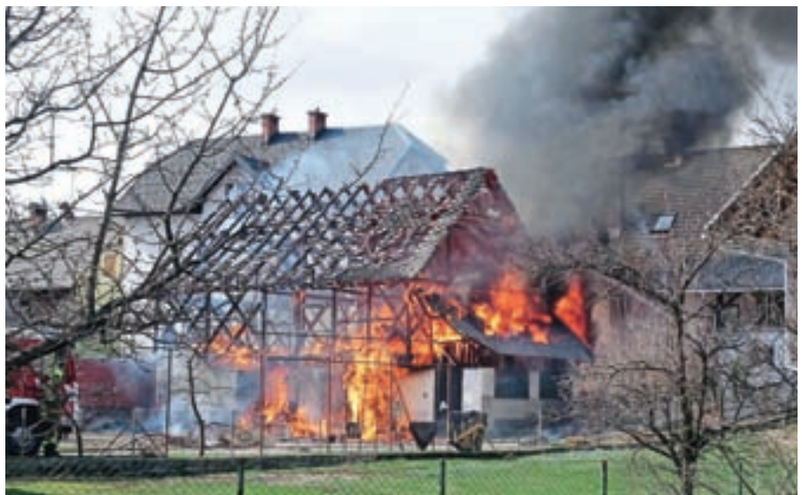
Na Bledu je ogenj uničil gospodarsko poslopje in stanovanje.