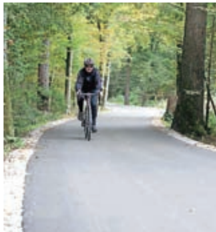
Kolesarska povezava med Šenčurjem in Kranjem

izvajati konkretne ukrepe, ki bodo občanom in obiskovalcem omogočili izbiro trajnostnih potovalnih načinov. Razvojna strategija pa se poleg prometnega dotika tudi drugih področij življenja občanov, od gospodarstva do kulturnega, športnega in družabnega življenja prebivalcev. Za kakovost njihovega življenja pa že zdaj skušajo storiti čim več. Tako so denimo spomladi preselili krajevno knjižnico, ki ima v najetih prostorih na Delavski cesti več prostora in v pritličju tudi lažji dostop.