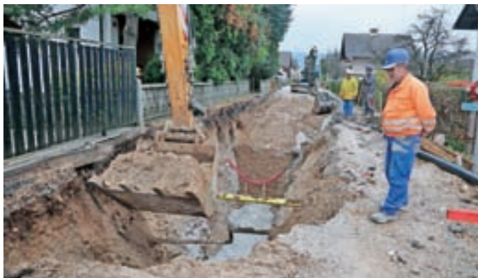
Gradnja kanalizacije v naselju Breg