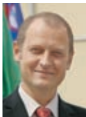
Župan Leopold Pogačar