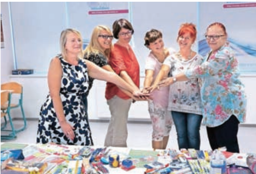
Jeseničani so v akciji Podari šolske potrebščine napolnili torbe dvajsetih osnovnošolcev.