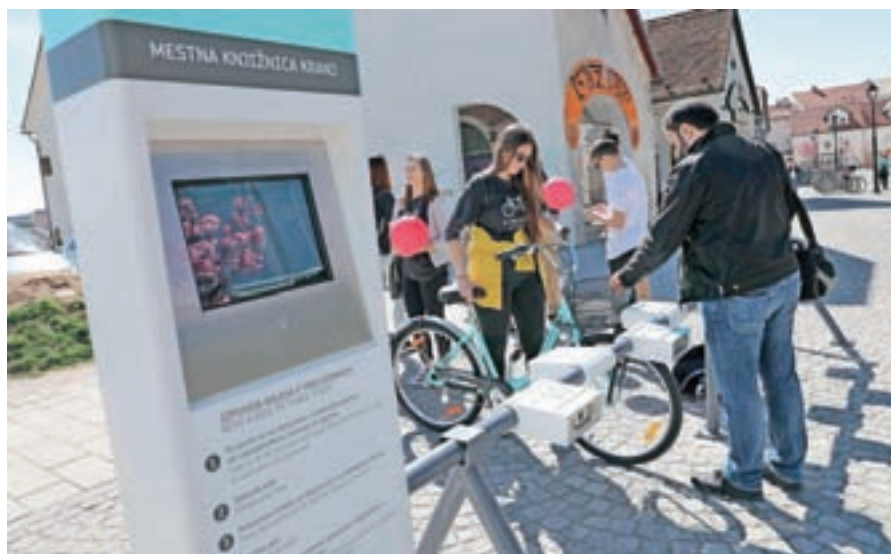
Sistem KRskOLESOM je bil med domačini in obiskovalci dobro sprejet, zato se bo v prihodnje še razširil.

Poleg skrbi za okolje je pomembna tudi prometna varnost, zato sta bila letos zgrajena nova cestna prehoda pri Trgovskem centru Tuš in pri kranjski vojašnici, nato pa še novo krožišče pri sodišču. Tal-