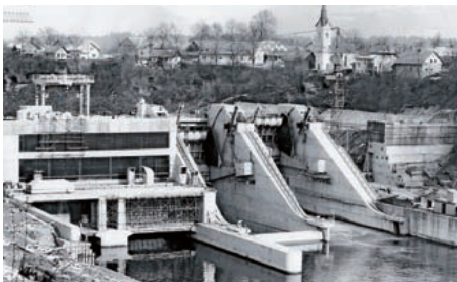
Gradnja HE Mavčiče, 24. 1. 1986