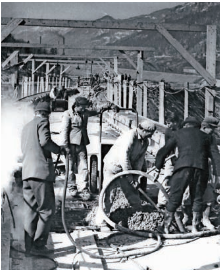
Gradnja nove valjarne na Koroški Beli, Jesenice, 2. 10. 1969

»Na pokušino vam tokrat ponujamo novo prilogo Gorenjskega glasa Odprte strani, ki bo prihodnje leto izhajala enkrat na mesec na štirih straneh. Zamislili smo si jo tako, da bi v njej objavljali poglobljene, polemične, kritične in