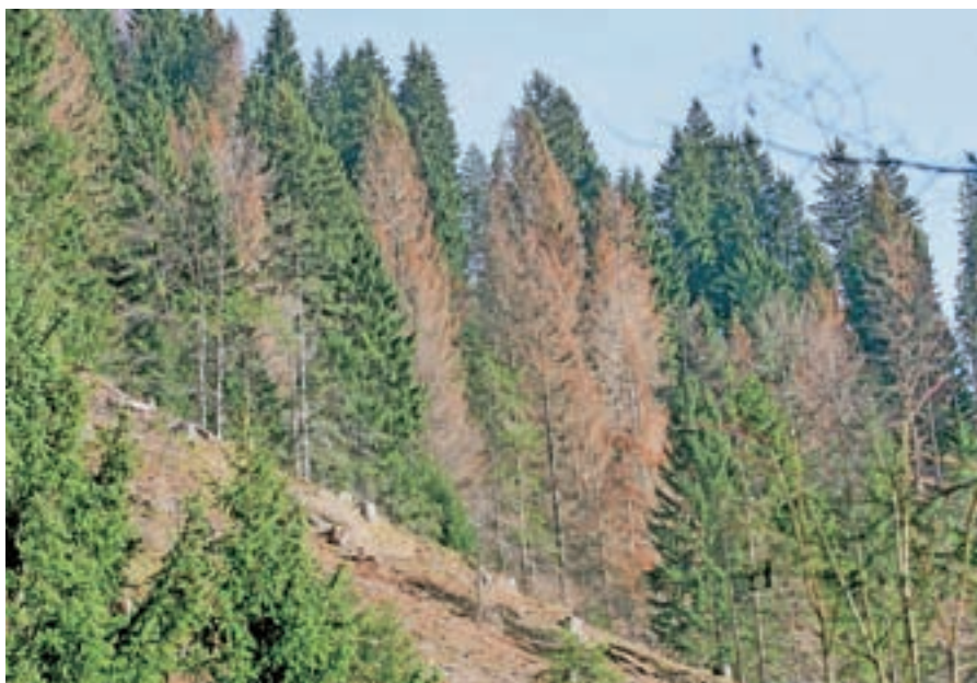
Zaradi lubadarja poškodovani gozd

Po 52 letih postavitve so podrli sedežnico na Zelenico, legendarno žičnico, ki je bila v dobrega pol stoletja priča vzponu tržiškega in tudi slovenskega smučanja, ki je v 47 letih delovanja (zadnja leta je mirovala, op. a.) popeljala v osrčje Karavank na tisoče planincev in je bila priča tudi tragičnim dogodkom, ko so zahrbtni zeleniški plazovi jemali ljudem življenja. Zeleni-