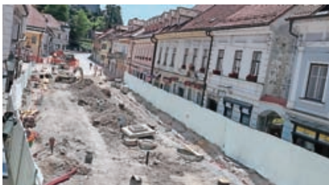
Glavni trg med obnovo ...

Člani KGT Papež so na Veliki planini gostili 16. evropsko prvenstvo v gorskih tekih. Kegljači KK Calcit Kamnik so postali državni prvaki, odbojkarji pa pokalni prvaki in državni podprvaki.