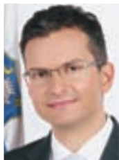
Župan Marjan Šarec