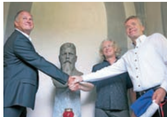
V kapelico nad Tavčarjevo grobnico so postavili nov doprnsni kip velikega Poljanca.

Škoda zaradi lubadarja na Gorenjskem podira rekorde. Najhuje je na blejskem območju, kjer so do avgusta odkazali posek skoraj 168 tisoč kubičnih metrov smrekovega lesa. Vročinski val je dose-