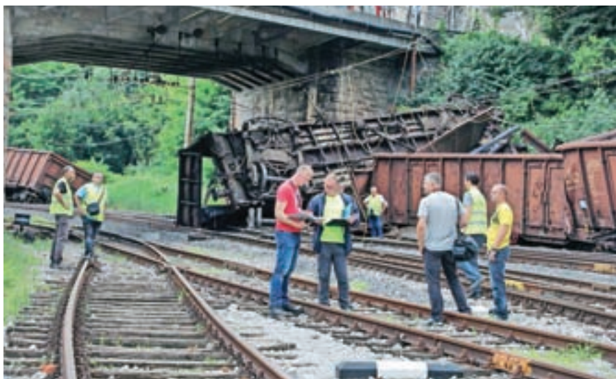
Iztirjeni vagoni na kranjski železniški postaji

gasilci in reševalci, ki so med najbolj obremenjenimi v državi (lani so imeli 1037 posredovanj), so dobili pol milijona evrov vredno novo vozilo. Prejšnje, staro 14 let, so podarili gasilcem v Gornji Radgoni. Družba Pokljuka, ki je povezana z ljubljansko nadškofijo, je po hotelu Bellevue v Bohinju kupila še hotel Pod Voglom. Turistično društvo Dovje - Mojstrana, staro 110 let, je uredilo na zemljišču domače agrarne skupnosti novo informacijsko točko ob Savi ob vstopu v vas. V Domžalah so temeljito preuredili stadion ob Kamniški Bistrici.