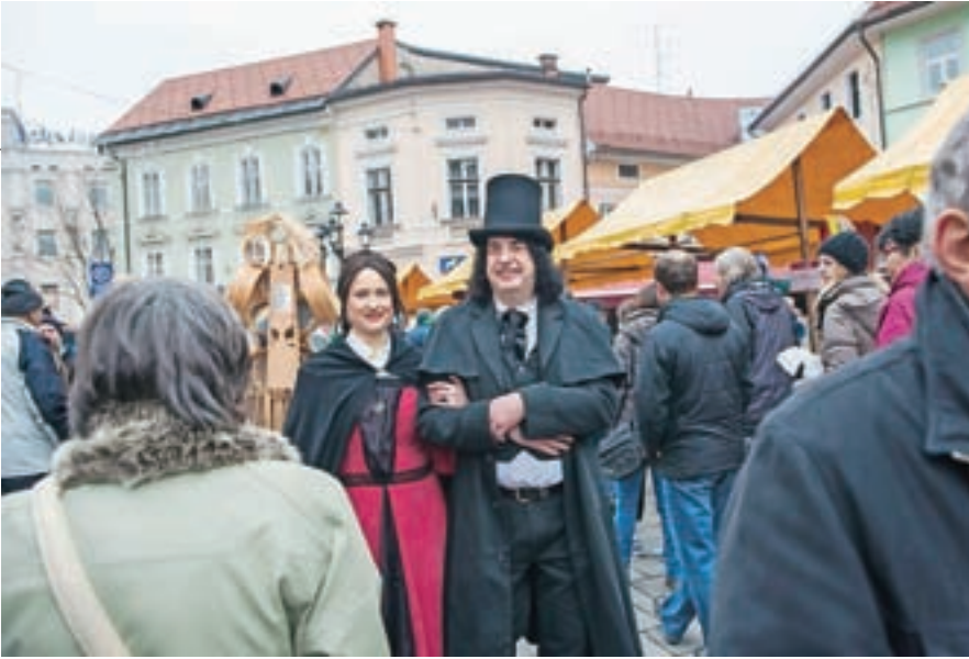
Na Gorenjskem je bilo za Prešernov praznik svečano. Še zlasti v Vrbi in Kranju.

preselili knjižnico iz majhnih prostorov v Domu Avto-moto društva v večje in primernejše.