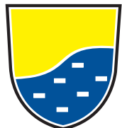
Občina Vodice Kopitarjev trg 1 Vodice