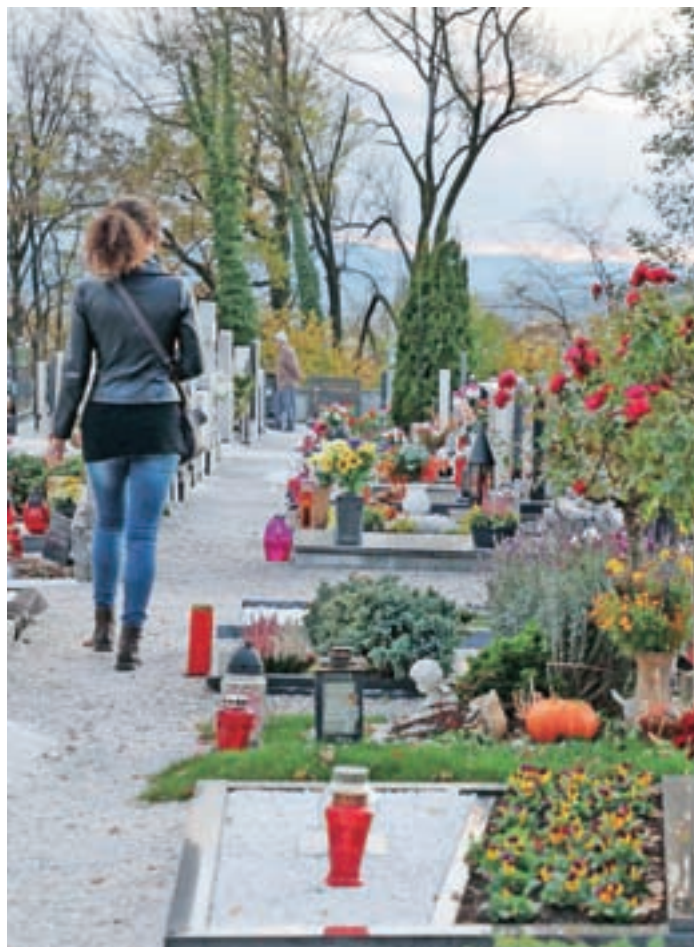
Povprečna starost umrlih se iz leta v leto počasi zvišuje.