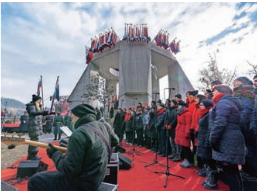
Januarja je minilo 75 let od boja Cankarjevega bataljona z Nemci v Dražgošah in tragedije vasi in vaščanov ter 60 let prireditve Po stezah partizanske Jelovice.