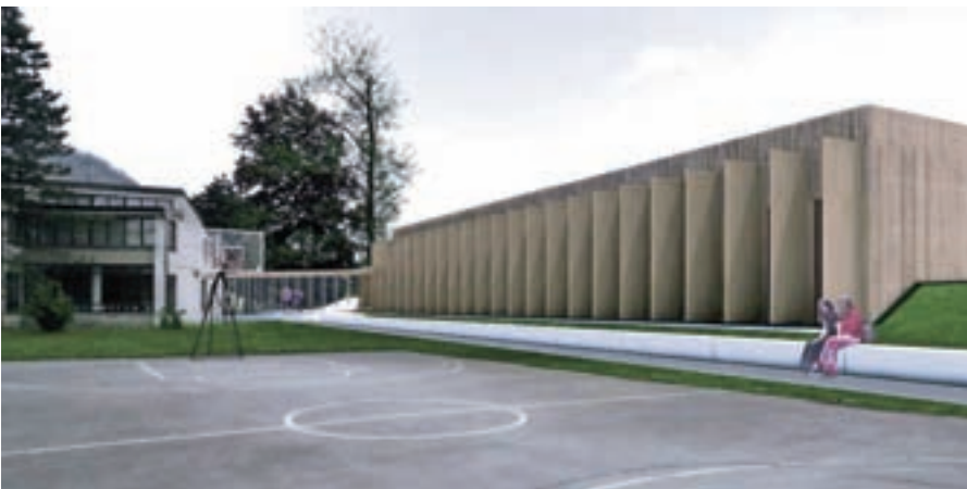
Oktobra se je začela gradnja nove telovadnice v Stražišću, ki naj bi bila dokončana jeseni prihodnje leto.

ne oznake za umirjanje prometa so bile postavljene v Mavčičah, varnejši dostop k šoli je bil urejen v Predosljah, nove so oznake za varnejšo pot kolesarjev in pešcev na Koroški cesti, urejena sta nova kolesarnica in prehod za pešce na Orehku.