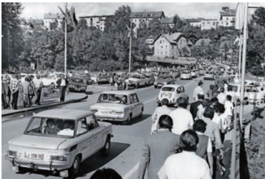
Gorenjski glas je beležil čas tudi v sliki: množični obisk Gorenjskega sejma v Kranju. / Foto: Gorenjski glas, hrani Gorenjski muzej