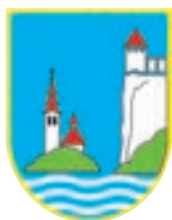
Občina Bled Cesta svobode 13 Bled