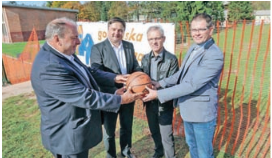
Svečan začetek gradnje nove telovadnice v Stražišču