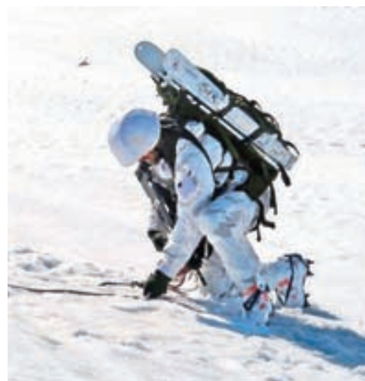
Vojak z novimi Elanovimi zložljivimi turnirni smučmi

praznovala petletnico uspešnega delovanja. Bled, ki je bil prvič omenjen leta 1013, je imel aprila občinski praznik. V Železnikih, ki jih statistika po kazalnikih razvitosti, stopnji zaposlenosti in kakovosti življenja občanov postavlja na prvo mesto v Sloveniji (visoko na lestevici so tudi Žiri, Gorenja vas - Poljane, Škofja Loka, Komenda in Cerklje) so obnovili poštni urad. Domžale so bile aprila pred 65 leti razglašene za mesto, kar so letošnjega aprila slovesno počastili. V Polja-