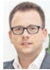
Župan Nejc Smole

Investicije potekajo tudi na področju poplavne varnosti. Večje protipoplavne ukrepe izvaja država (sanacija pragu na na sotočju na reki Sori, končana so dela na odseku struge vodotoka Ločnica v naselju Sora) in tudi občina (izvedeno je bilo čiščenje nekaterih padavinskih jarkov).