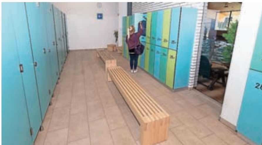
Prenovili so garderobe in vhodno avlo ob plavalnem bazenu.