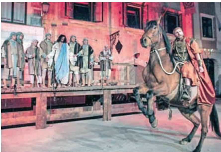
Škofjeloški pasijon je del zaščitene Unescove nesnovne kulturne dediščine.

Med odmevnejše dogodke lanskega decembra uvrščamo prodajo kranjskogorskega hotela Alpina, odprtje novih cest med Kovorjem in Brdom ter Potarji in Tičem v trziški občini, počastitev jubilejev Osnovnih šol Davorina Jenka Cerklje in Matije Valjavca Preddvor, praznike občin Žirovnica, Gorenja vas –