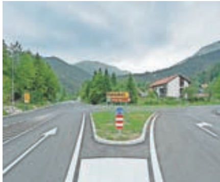
V Podljubelju je sodobno in varno križišče.

Križe, ki povezujejo štiri krajevne skupnosti, so bile tudi letos veliko gradbišče. Uredili smo Kriški trg, ki se s povezavo z obnovljeno cesto, avtobusnima postajališčema, pločniki, prehodi za pešce in javno razsvetlavo nadaljuje v smeri šole in modernejšega centra vasi. Projekt je posodobil asfaltni dostop do teniških igrišč in naprej proti Pristavi, meteorno odvodnjavanje ter novo makadamsko parkirišče za velike potrebe vasi in nastajajočega razširjenega športnega parka Križe. Veseli smo podatka, da je Tržič vse bolj zanimiv za turiste. Bogati se tudi ponudba zanje. S petimi novimi namestitveni-