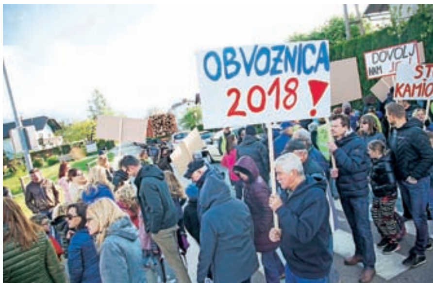
Vodičani so zahtevali zgraditev obvozne ceste.

Po marčni nesreči na Kamniški cesti, v kateri je bil poškodovan šolar, je Vodičanom prekipelo. Več kot tristo se jih je zbralo na shodu sredi vasi, na katerem so zahtevali večjo prometno varnost in zgraditev obvozne ceste mimo vasi. Sedaj gre dnevno skozi vas deset tisoč vozil, od tega 1700 tovornjakov. Glas so privzdignili tudi nekateri prebivalci Ročevnice v Bistrici pri Trziču, katerih parcele tržiška občina leta 1989 ni vpisala v zemljiško knjigo. Občina je prevzela moralno in materialno odgovornost in