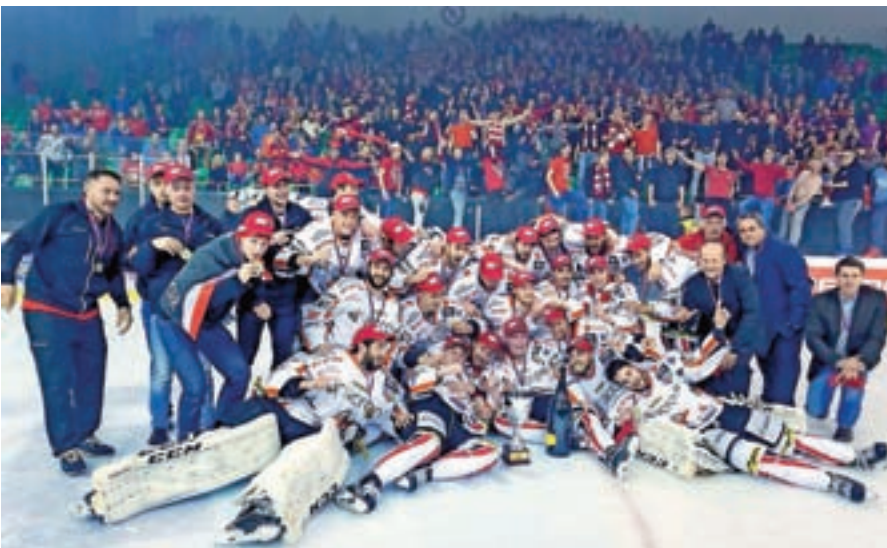
Hokejisti moštva SIJ Acroni Jesenice so hokejski državni prvaki.