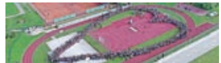
S tržiško verigo srca se je začel projekt Tržič – mesto dobrih misli in želja.