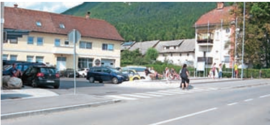
Prenovljen Kriški trg, ki je dobil varnejši izvoz.