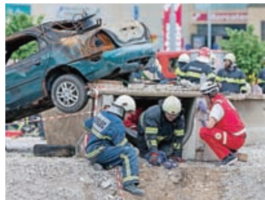
Maja je v občini Medvode potekala velika dvodnevna vaja Potres 2017.