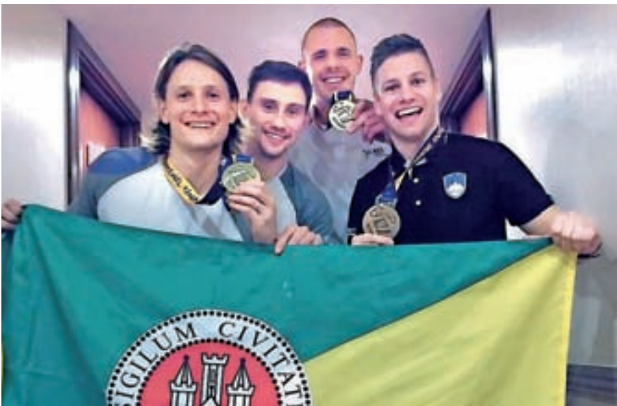
Loški roketni junaki z zastavo občine Škofja Loka

lo. Posledica tega je bilo manj brezposelnih. Hudo je primanjkovalo tehnično usposobljenih kadrov, kar je posledica preteklega preveč družboslovno usmerjenega izobraževanja. Na Trati v Škofji Loki so začeli graditi kisikarno, 17 milijonov evrov vredno naložbo družbe Messer Slovenija. Škofja Loka bo dobila nova delovna mesta, proizvodnja pa bo okolju prijazna. Škoda, ki jo povzročajo divjad in nekatere zveri, je na Gorenjskem vedno večji problem. Marsikje sta prosta paša govedu in drobnice ogroženi.