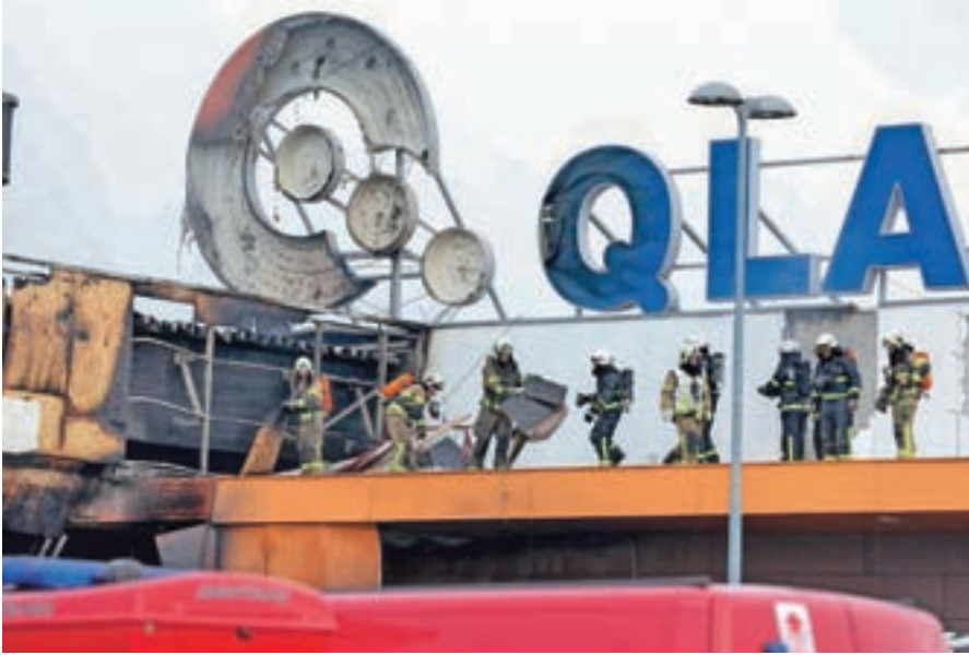
Požar v Qlandii je bil največji požar v kranjskih trgovskih središčih doslej.