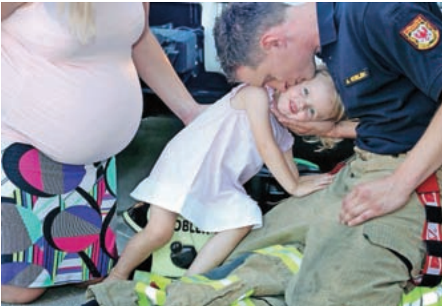
Lani se je že deveto leto zapored rodila generacija z več kot dvajset tisoč otroki.

20 tisoč otroki, vendar je številka z vsakim letom nižja. Lani se je v primerjavi z letom 2015 rodilo 296 otrok manj. Ponovno se je zvišala povprečna starost