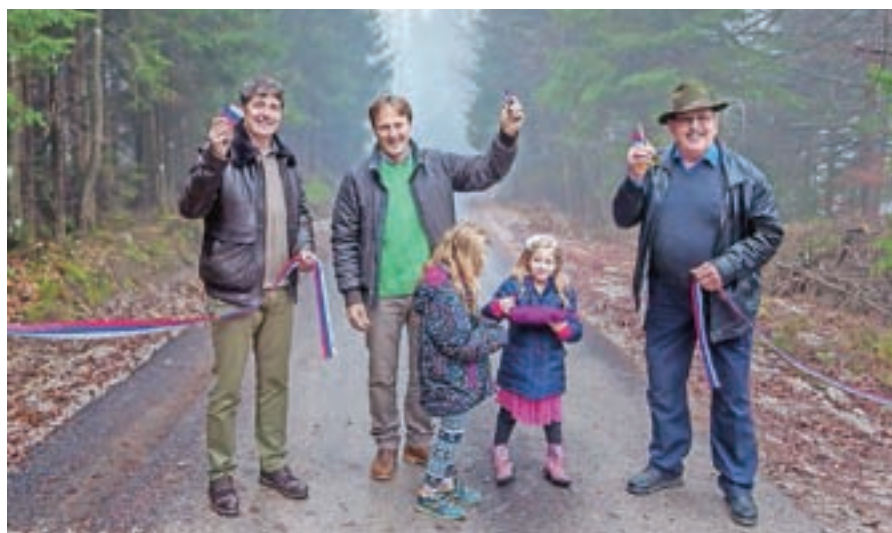
Obnovljena cesta Potarje–Tič je najvišje ležeča asfaltirana cesta v trziški občini.

vljica, graditev komunalnih naprav v severnem delu šenčurske občine in srečen dan za Meto Krajnik iz Škofje Loke, ki se je lahko tudi zaradi pomoči dobrih ljudi vselila v obnovljeno stanovanje v mestu, ki ga je na silvestrovo leta 2014 poškodovala eksplozija.