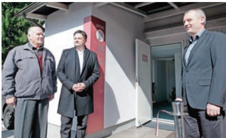
Odprtje Fajdigove ambulante v Kranju za ljudi brez zdravstvenega zavarovanja

Med marčnimi dogodki na Gorenjskem postavljam v ospredje tradicionalno Planico. Za lansko smo dejali, da je bila slovenska veselica. Letošnja je bila avstrijska, vendar je bila vseeno naša, veličastna, praznična. Slovenski letalci niso bili v ospredju. Še najboljša sta bila Peter Prevc na šestem in Jurij Tepeš na osmem mestu. Drugi naši so bili bolj zadaj. Tekme si je ogledalo več kot 75 tisoč ljudi, zmagal pa je Avstrijec Stefan Kraft. Zaslužen. Trije letalci so poleteli več kot 250 metrov. Najdlje Poljak Kamil Stoch, in sicer 251,5 metra, kar je bil novi rekord planiške letalnice. Pri doskoku je podrsal, vendar so ga sodniki priznali kot »stoječega«. Ekipno je zmagala Norveška. Slovenija je bila peta. Svetovni pokal je dobil Kraft, Domen in Peter Prevc pa sta bila šesti in deveti, v točkovanju poletov so bili Peter Prevc peti, Jurij Tepeš osmi in Domen Prevc deveti. Odlične uvrstitve, vendar brez zmagovalnega sijaja! Tudi v Kranjski Gori so kljub slabemu vremenu odlično izpeljali slalomsko in veleslalomsko tekmo za svetovni pokal. Še zlasti je blestel Avstrijec Marcel Hirscher, zmagovalce svetovnega pokala, ki je bil prvi v veleslalomu in četrti v slalomu. Naša najboljša sta bila Žan Kranjec in Štefan Hadalin. Ilka Štuhec je tudi na tekmah v Južni Koreji ostala med najboljšimi. Od obljub naših nogometašev, da bodo proti Škotski v kvalifikacijah za svetovno prvenstvo v