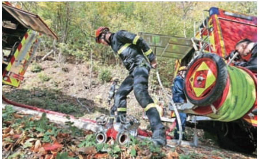
Oktober je bil mesec požarne varnosti. Na pobočju Šmarjetne gore nad Kranjem je bila velika gasilska vaja.