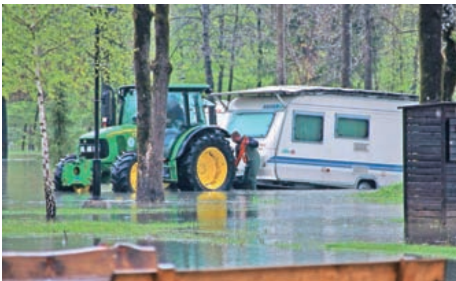
Reševanje prikolic v bohinjškem kampu Danica