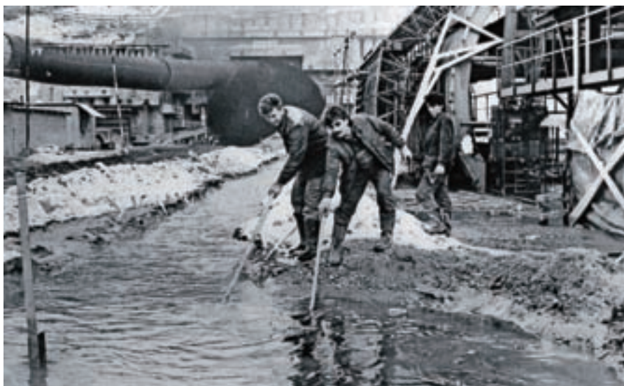
Močan izvir vode ovira gradnjo Karavanškega predora, 1989.