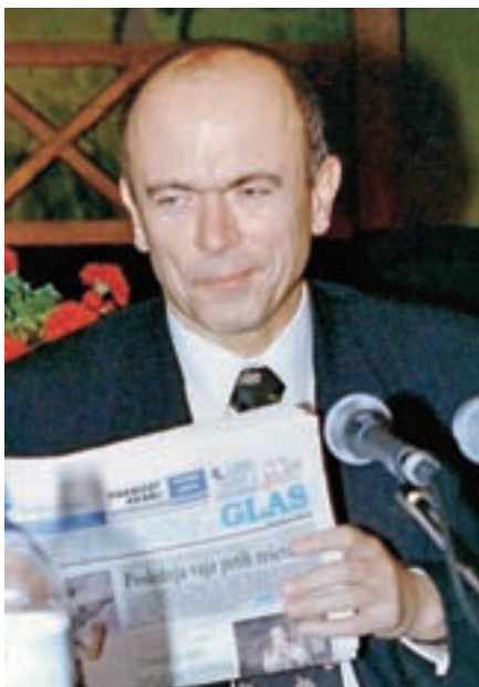
Dr. Janez Drnovšek je bil kot predsednik vlade gost Glasove preje pri Avseniku v Begunjah, 12. 6. 1997.

bila leta tranzicije, velikih družbenih sprememb, ki so se po svoje odražale tudi v časopisu. Razlika je v tem, da so se mnogi mediji tem spremembam le pasivno prirejali, naš časopis pa jih je »sourejal«, z njimi se je pod vodstvom urednice soočal aktivno, se odpiral spremembam in ni naključje, da je izhajal pod njenim geslom Več kot časopis. Odpiranje časopisa pa je potekalo takole: že 1986 je nova urednica odprla strani Gorenjskega glasa pismom bralcev in odmevom, ki so bili že pluralno obarvani. Leta 1987 začno, kot rečeno, izhajati Odprte strani, namenjene poglobljeni obravnavi takratne problematike, poleg Glasovih hišnih peres jih pišejo tudi ugledni slovenski avtorji. Leta 1988 se začne Glasova preja, cikel javnih intervjujev, ki še vedno traja, ima že 124 ponovitev in najdaljšo tradicijo te vrste v državi; istega leta začno ponovno izhajati Snovanja, z ambicijo, da postanejo gorenjska kulturna revija. Leta 1989 pomaga Gorenjski glas shoditi Demokraciji, prvemu neodvisnemu političnemu časopisu v Jugoslaviji; prve štiri številke izidejo pod dežnikom in ob logistični podpori Gorenjskega glasa, naslednje samostojno. Gorenjski glas je v tistih letih večkrat objavil tudi drzne Mladinske strani. Za vse to je bilo treba na položaju odgovorne urednice veliko poguma, nekateri so se temu upirali, tudi grozili so ji in ni ji bilo zmeraj lahko.