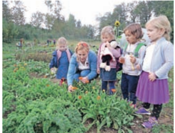
V letošnji izjemni turistični sezoni v občini Radovljica beležijo četrtr milijona nočitev. Šolski učni vrt deluje v sklopu projekta Narava nas uči.

Rekonstrukcija je bila zaključena tik pred koncem počitnic, tako da se je letošnje šolsko leto začelo z bistveno izboljšano varnostjo na šolskih poteh. Občina je namreč s prvim septembrom na Letališki ulici v Lescah z novim pločnikom dopolnila varno šolsko pot, na odseku Begunjske ceste mimo šole pa je po novem prepovedan promet za tovorna vozila. Na poti iz Kamne Gorice do OŠ Staneta Žagarja Lipnica je umeščen nov prehod za pešce na priključku za Zgoranje Dobravo, kjer je v bližini postavljeno tudi pokrito avtobusno postajališče. Drugo takšno novo avtobusno postajališče pa je urejeno na Dobrem Polju.