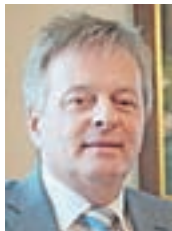
Župan: Ciril Globočnik