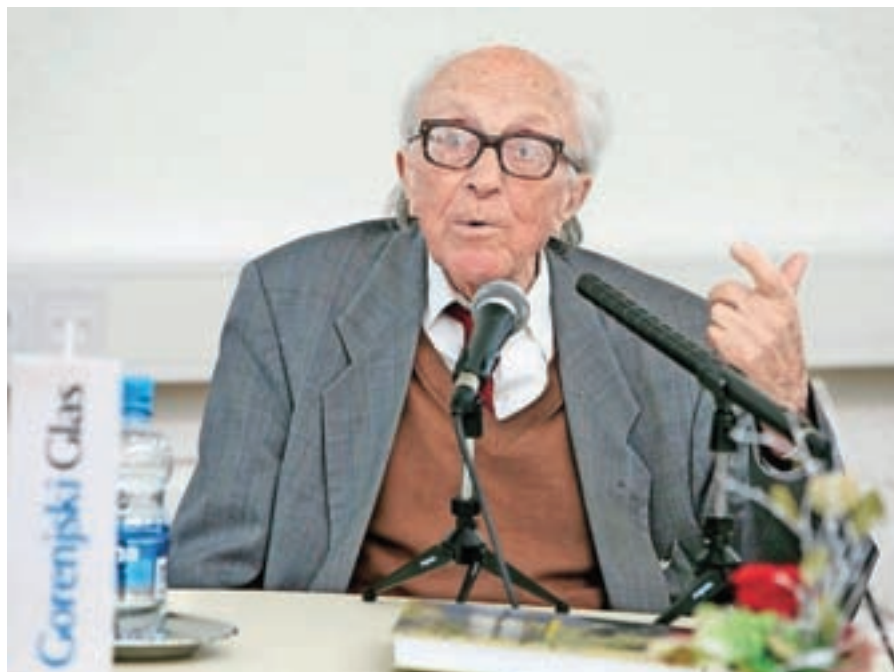
Pisatelj Boris Pahor je bil gost Glasove preje na Gimnaziji Kranj, 9. 9. 2010.