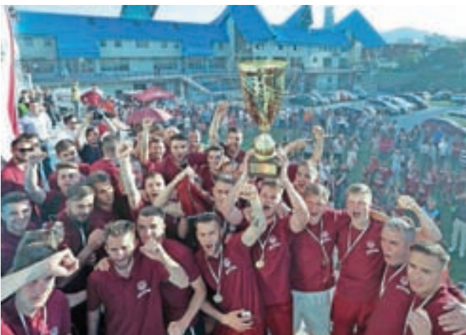
Nogometaši Triglava so poskrbeli, da je v občini znova nogometni prvotigaš.

Obeleženi so bili številni jubileji klubov in društev, med njimi sto štirideset let podružnične šole v Goričah, sto let podružnične šole v Podblici, sedemdeset let Mestne knjižnice Kranj, šestdeset let Kolesarskega kluba Kranj in petdeset let Kranjskih vrtcev.