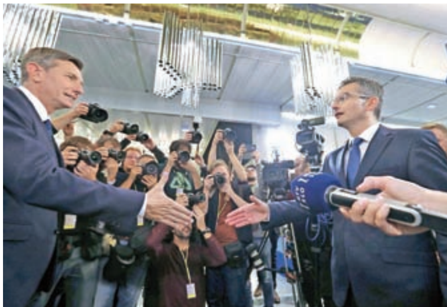
Finalista predsedniške tekme: Borut Pahor in Marjan Šarec

Končno, so rekli tisti, ki poznajo leta trajajočo zgodbo gradnje nove telovadnice pri osnovni šoli v Stražišču, in učitelji ter učenci osnovne šole. Za dobra dva milijona evrov jo bo gradila Gorenjska gradbena družba, ki jo bo 15 let upravljala in vzdrževala. V Lučinah so obnovili odsek ceste proti Horjulu. Na Blejski Dobravi so predali prometu dolgo pričakovano obvoznico mimo Lipc, ki bo razbremenila promet na območju Lipc in Blejske Dobreve. Modernjša je tudi cesta od Praprotnice proti brniškemu letali-