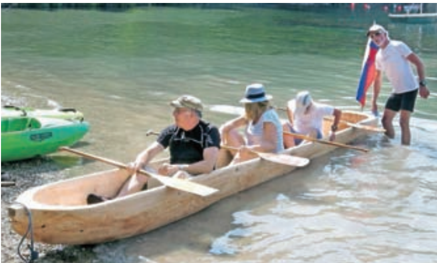
Krstna vožnja čolna deblaka po Bohinjskem jezeru