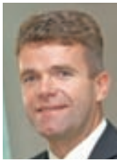
Župan Milan Čadež