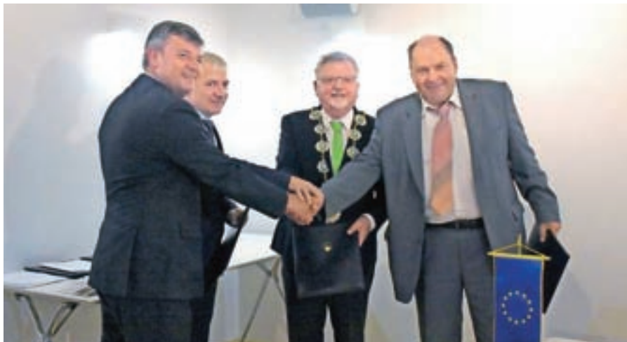
Podpis pogodbe o sofinanciranju severne razbremenilne ceste na Bledu

Stalnica slovenske politike do konca leta je bila odločitev mednarodnega arbitražnega sodišča v Haagu o meji med Slovenijo in Hrvaško. Sloveniji je bila na morju dodeljena oblast nad dvema tretjinama Piranskega zaliva in omogočen prost dostop do mednarodnih morskih voda. Sporazum bi moral biti uresničen in meja zakoličena do konca leta, vendar Hrvaška temu nasprotuje. Zaradi slovenskega kršenja pravil med postopkom odločanja v Haagu, tako pravi sosedja, je Hrvaška odstopila od arbitražnega sporazuma, ki je bil podpisan pod pokroviteljstvom Evropske unije. Sosednja država je po sprejetju razsodbe konec junija pogosto povzročala tudi incidente v Piranskem zalivu, ki so na srečo minili brez hujših posledic. Odločitev sodišča je, tako pravijo tudi tuji strokovnjaki, uravnotežena. Evropska unija je sporočila, da je treba mednarodno pravo spoštovati in ta sporazum je njegov del. Slovenija bo sprejela ustrezne ukrepe in zakone, ki bodo olajšali življenje ljudem, ki bodo ostali na hrvaški strani, omogočena pa jim bo tudi preselitev na slovensko stran.