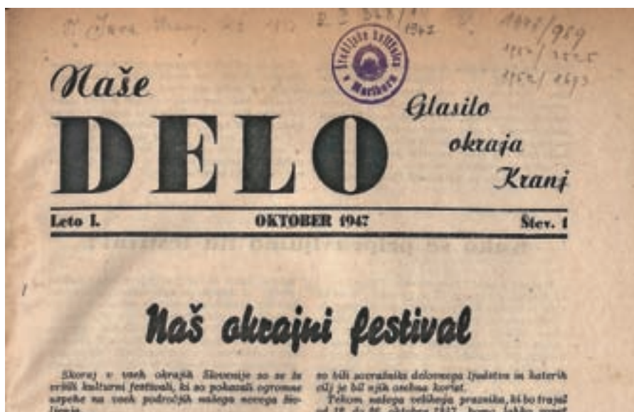
Prva stran glasila Naše delo, ki je prvič izšlo oktobra 1947 in velja za neposrednega predhodnika Gorenjskega glasa. Edini nam poznani izvod hrani Univerzitetna knjižnica v Mariboru.

»S prireditvijo Novoletne jelke, ki so se je udeležili otroci v vsem okraju, po mesetih in vaških šolah, je bil storjen prelom s klerikalnim miklavževanjem, ki je mistično varal naše otroke in jih odtujeval stvarnosti. Najboljša je bila organizacija Novoletne jelke v Trziču. Priredili so jo na več krajih, v tovarnah in v mestu. Bilo je tu lutkovno gledališče pa partizanski tabor, kjer so partizani pripovedovali našim malčkom prigode iz NOB. K vsem pa je prišel dedek Mraz v spremstvu